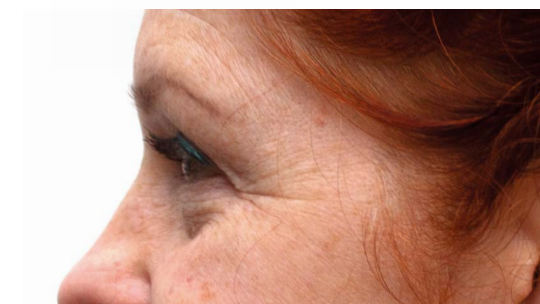
Na 12 weken collageen